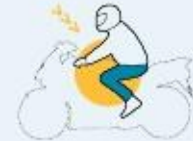
Conductores de motocicletas

Pantalones gruesos Las estadísticas no son indicativas