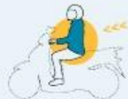
Conductores de ciclomotores