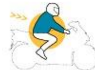
Conductores de motocicletas

De acuerdo con las pruebas reunidas en el MAIDS*, el estudio de los accidentes de motos más detallado realizado hasta ahora, los motoristas que llevan el equipamiento de protección adecuado tienen menos lesiones en caso de accidente. Las estadísticas relativas a las lesiones del MAIDS se resumen en un indicador que informa a los consumidores de las ventajas de llevar el equipamiento de protección adecuado. El "Factor de Protección" indica el porcentaje de accidentes del MAIDS en los que el equipamiento de protección atenuó o incluso evitó lesiones.