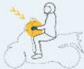
Conductores de ciclomotores