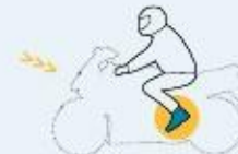
Conductores de motocicletas

Botas de motociclista Factor de protección : 89 %