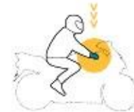
Conductores de motocicletas

Guantes gruesos Factor de protección : 87 %