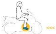
Conductores de ciclomotores