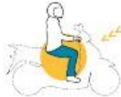
Conductores de ciclomotores